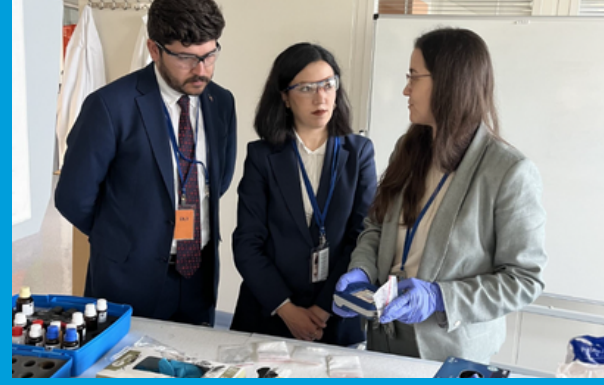
Türk Heyeti, Uyuşturucu Kaçakçılığıyla Mücadelede İş Birliğini Güçlendirmek Amacıyla Viyana'daki UNODC Laboratuvarını Ziyaret Etti

UNODC Güneydoğu Avrupa Bölge Ofisi (ROSEE), İstanbul UNODC Proje Ofisi, Ankara